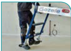
Stabilisateurs rabattables au pied + pratiques et + rapides à mettre en place.