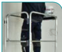
Garde-corps avec portillon pour une protection permanente et incontournable.