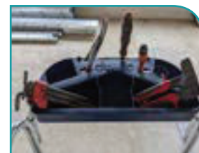
Tablette multifonctions grande capacité (30 Kg), porte-outils et adaptée pour fût de 15 L.