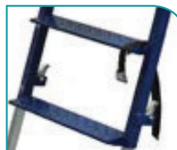
Accès par larges marches avec antidérapant puissant.